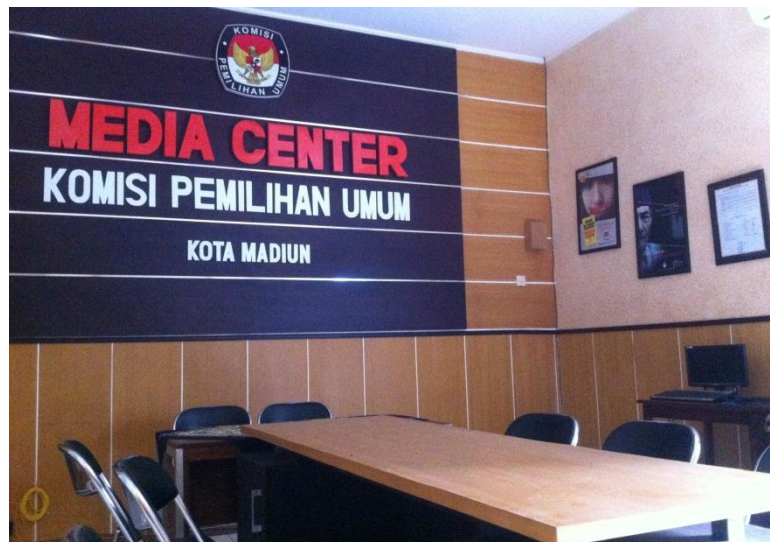
Ruangan PPID Kota Madiun Pada Bulan Juni 2016

Pada bulan Juli mendatang Desk PPID menjadi lebih informatif, yaitu dengan penambahan aksesoris seperti adanya x-banner yang berisikan jenis pelayanan yang diberikan oleh PPID KPU Kota Madiun ataupun alur permohonan informasi publik. Design selesai pada bulan Juni ini, dan akan diaplikasikan di ruangan PPID pada bulan Juli mendatang.